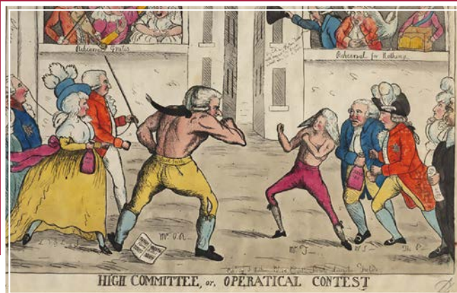
HIGH COMMITTEE, or, OPERATIONAL CONTEST